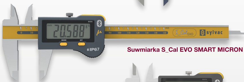
Suwmiarka S_Cal EVO SMART MICRON